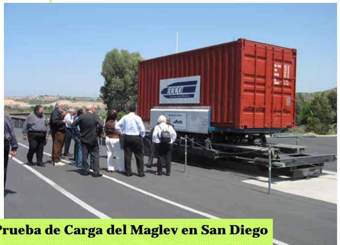
Miembros del Directorio en la Pista de Prueba de Carga del Maglev en San Diego